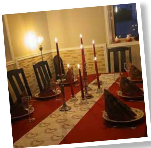
Julebordet er dekket på Beit Betania