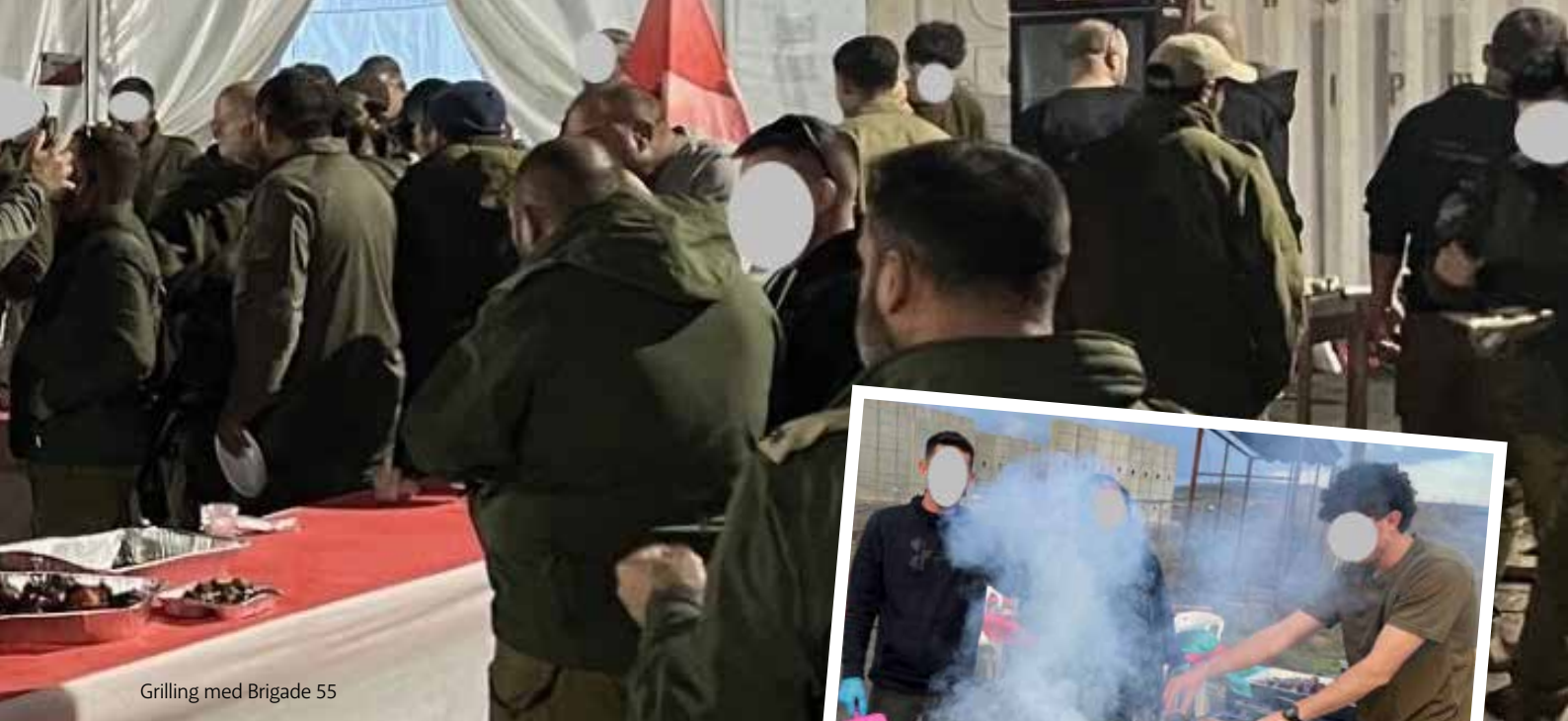
Grilling med Brigade 55