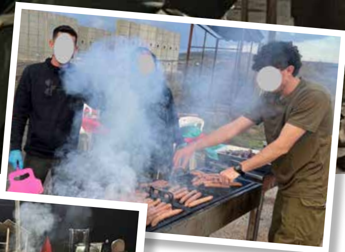
Grilling med Brigade 55

for at Israel gjør forskjell på folk. Vår statsminister Jonas Gard Støre ble nektet innreise til Israel, men jeg fikk komme inn i landet og ikke nok med det, dere har invitert meg helt fremst i frontlinjen. Dette utsagnet ble jo sagt med glimt i øyet, men alle som var der satte pris på det. Norge står ikke høyt i kurs i Israel i dag.