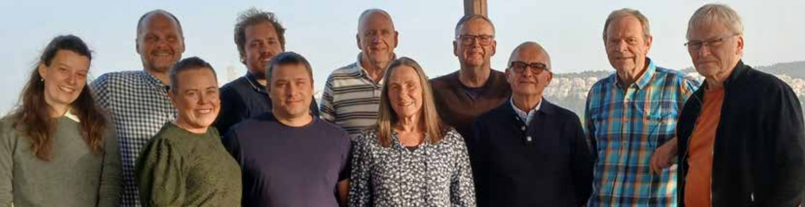
Alle volontørene og bestyrelsesrådet samlet på Shabbaten på Beit Betania